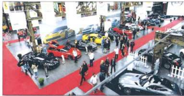
Viel los wird in den Hallen auch am 21. und 22. Mai sein.