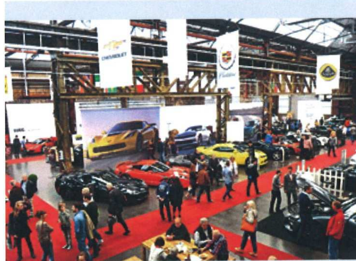
2. Auflage des Salons am 21./22. Mai 2016. Infos unter www.cabrio-salon.de