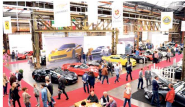
Der Cabrio- und Sportscars Salon öffnet am kommenden Wochenende wieder seine Pforten auf dem Areal Böhler in Büderich. Wir verlosen Karten.