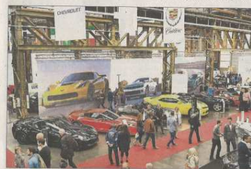
Alles, was Rang und Namen hat, kann im „Sportscars-Salon“ bewundert werden.

„Ferrari“, „Bugatti“ zeigt den legendären Veyron und „Ferrari“ ist mit dem „488 Spider“ präsent und zeigt erstmals den „California T HS“.