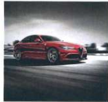
Der Alfa Romeo Giulia macht eine gute Figur.

Die neue Alfa Romeo Giulia kann ab sofort unter anderem in Deutschland, Italien, Frankreich, Spanien, Österreich, Belgien, der Schweiz und den Niederlanden bestellt werden. Zur Wahl stehen drei Ausstattungsstufen, neben der Basis Alfa Romeo Giulia die Versionen Super und Quadrifoglio. Als Antrieb dienen komplett neu entwickelte Motoren. Der Turbodiesel mit 2,2 Liter Hubraum steht in drei Leistungsstufen zwischen 100 kW (136 PS), 110 kW (150 PS) und 124 kW (169 PS) zur Verfügung. Der Viertüriger kann mit einem manuellen Sechsganggetriebe oder Achtgang-Automatik ausgestattet werden. Das Topmodell Alfa Romeo Giulia Quadrifoglio wird von einem V6-Benziner mit 2,0-Liter-Hubraum angetrieben, der aus 2,9 Liter Hubraum 175 kW (238 PS) produziert und mit