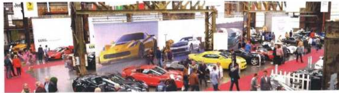
Blick in die CSS 2015