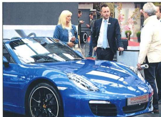
Der Bote verlost für die 2. Cabrio & Sportscars Salon Düsseldorf vom 21. bis 22. Tickets.