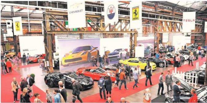
Knapp 8000 Besucher hatte die Premiere des Cabrio & Sportscars Salon im vergangenen Jahr in den Alten Schmiedehallen auf dem Areal Böhler angeregt. Am Wochenende folgt die zweite Auflage.